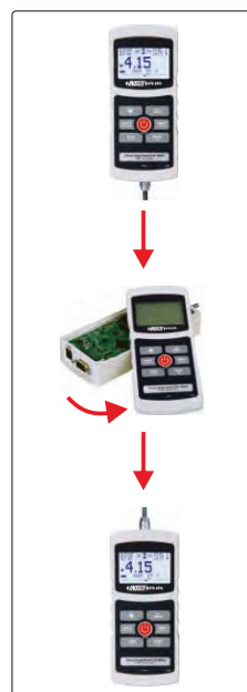
屏幕及面板可旋转180°

设定上下限显示 上下限判断 电池电量显示 存储个数显示 拉力/推力指示 峰值显示 读数 测量模式 测量单位 模拟读数显示